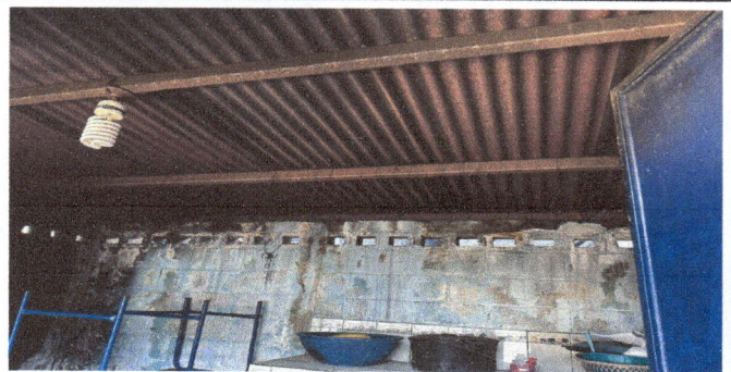
Foto 6: Remozamiento de columnas, cambio de Lamina troquelada y repello.

Observación: Si es necesario se pueden agregar hojas adicionales y actualizar el contenido de hojas.